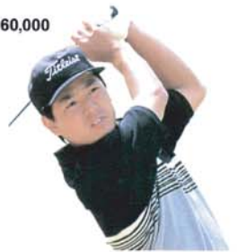
591アイアン使用プロ: 格闘繁正