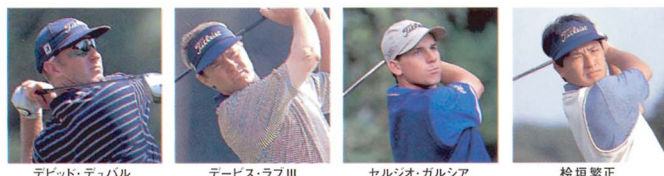
デビッド・デュバル