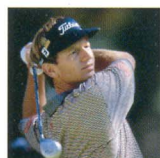
ブラッド・ファクソン