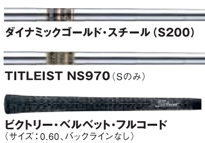
ダイナミックゴールド・スチール(S200)