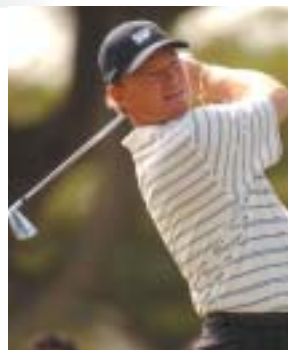
アーニー・エルス