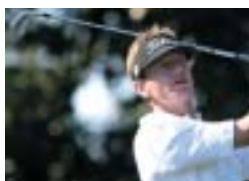
ブラッド・ファクソン